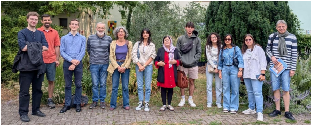
La Summerschool à Illkirch-Graffenstaden