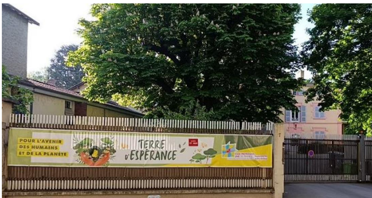
Terre d'Espérance, Lyon-Oullins, 17 mai 2025