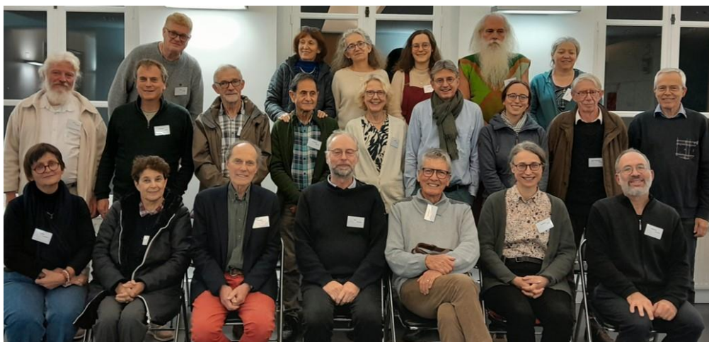
Week-end 2024 à l'Institut Protestant de Théologie de Paris