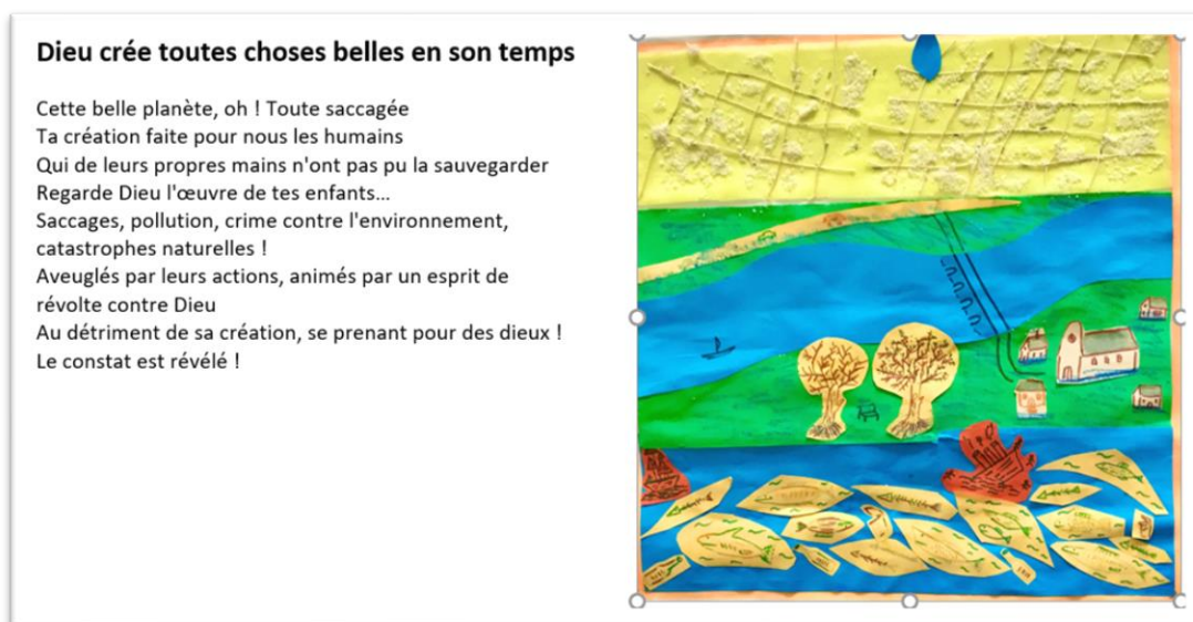
Une œuvre réalisée à Blois dans un atelier “Par amour de la Terre”