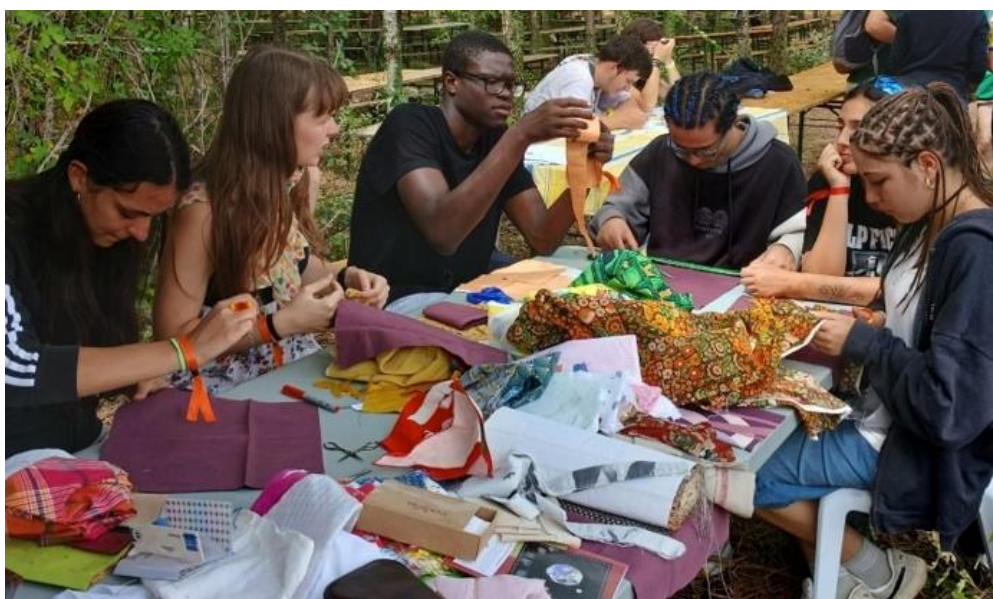
L'atelier « Par amour de la terre » animé par l'équipe Église verte du Bergeracois au Grand Kiff 2025