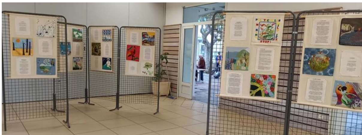
L'exposition "Par amour de la Terre" au Synode régional Cévennes-Languedoc-Roussillon, novembre 2024