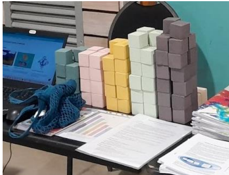
Le matériel de l'animation “Qui veut économiser des tonnes de CO2” ?