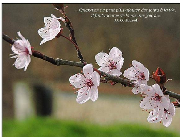
Mise en page et illustrations photographiques : Patrice BOUTON